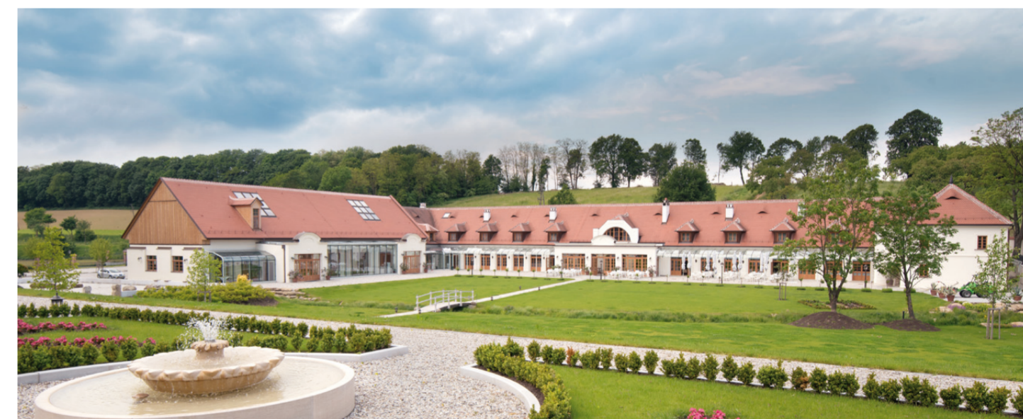
Blick auf den Festsaal und das Restaurant „Am Schlossgarten“ von den oberen Terrassen

Sie werden fasziniert sein, von der Qualität unserer Küche und dem einzigartigen Flair der Räume.