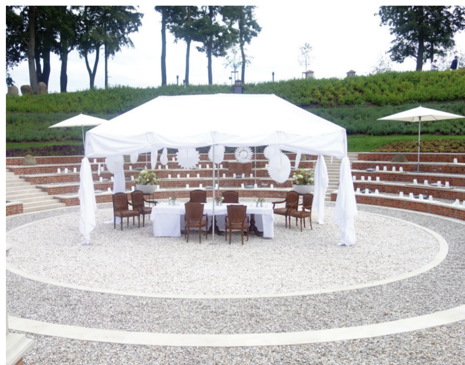
Unsere einzigartige Gartenbühne für Ihr Fest

Unsere Gartenbühne als Kulisse für eine einzigartige Zeremonie