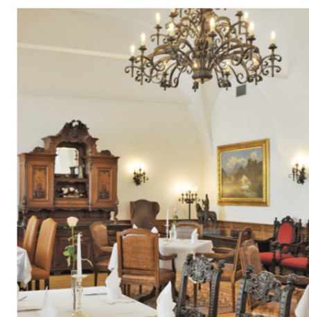
Restaurant „Weißer Ritter“

Weißer Ritter Größe: 60 m 2 Kapazität: 30 Personen Restaurant „Am Schlossgarten“ Größe: 100 m 2 Kapazität: 80 Personen Raum Provence Größe: 60 m 2 Kapazität: 40 Personen