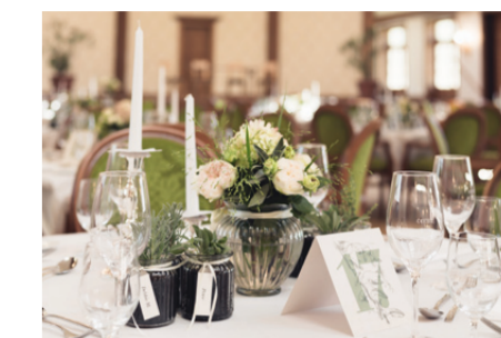
Die persönliche Note darf nicht fehlen.

integrierten Technik auf neuestem Stand hat jeder stolze Brautvater genug Platz und Möglichkeit, seine Rede an die Gesellschaft in passender Art und Weise zu zelebrieren.