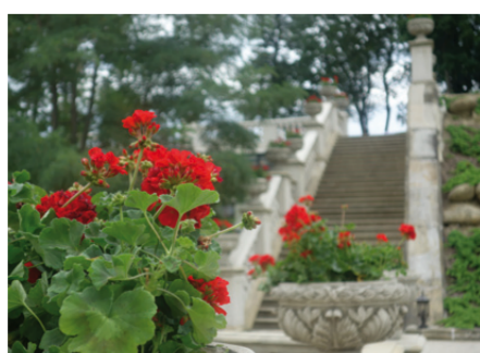
Historische Treppe für romantische Fotos