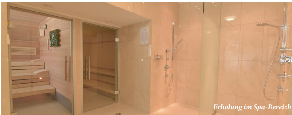
Erholung im Spa-Bereich

Wellness und Kosmetik im Schloss THALHEIM