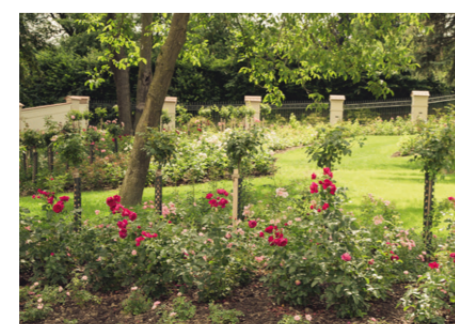
Symbole der Liebe – unsere Rosengärten