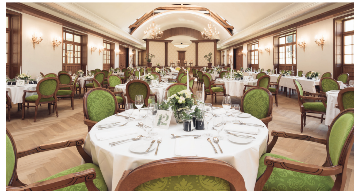
Stimmungsvolle Atmosphäre – der beeindruckende Festsaal als idealer Rahmen für unvergessliche Hochzeitsfeste

... und das Auge isst im eindrucksvollen Festsaal gerne mit