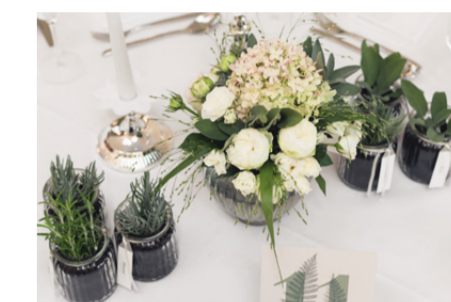
Ensemble mit viel Liebe zum Detail

Festsaal Größe: 650 m 2 Kapazität: 70 - 250 Personen